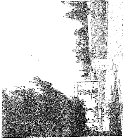
L'INCROCIO Le strade della discordia