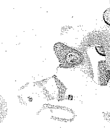
Chicco Rodolfo Offerta € 59,90