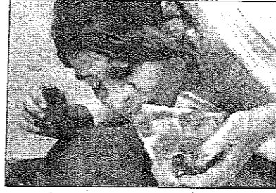
Una scena di "Focaccia blues"

"Focaccia blues", sottotitolo "la vera storia della focaccia che si mangiò l'hamburger", è il film in programma questa sera (ore 21) al Manzoni di Casarano nell'ambito della rassegna "Giovedì d'autore". La pellicola del regista barese Nico Cirasola ha suscitato grande interesse tanto da meritare la "Menzione Speciale" ai recenti Nastri d'Argento ed il "Ciak d'Oro 2009". Il film è stato girato, sia in Puglia che in America per raccontare la vera storia di una piccola focaccia di Altamura riuscita nell'impresa di sconfiggere un grande Fast Food con l'affermazione della classica focaccia barese. Per