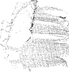
T-shirt neonato € 10,00